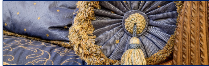
Versteckte Schönheiten und Geschichten