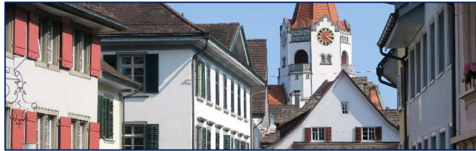
Der alte Ortskern ist geprägt vom Bild des 19. Jahrhunderts