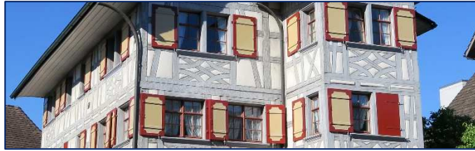
Prächtig renovierte Riegelbauten sind Zeugnisse des 17. und 18. Jahrhunderts

Alle Angaben finden Sie auch im Internet auf www.weinfelden.ch in der Rubrik «Führungen» oder direkt in www.rundgangweinfelden.ch