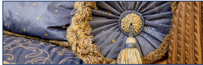
Versteckte Schönheiten und Geschichten